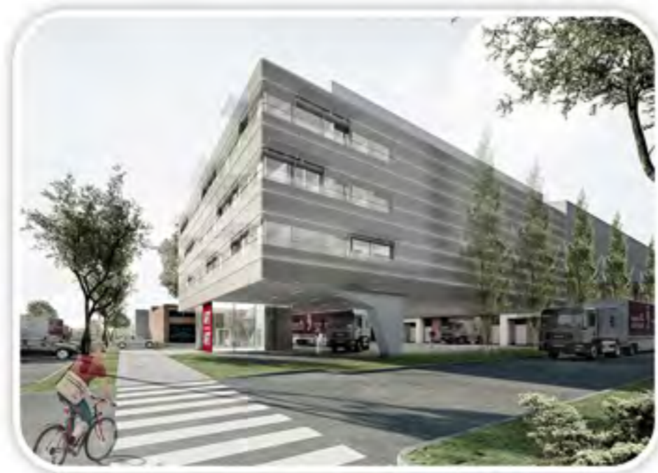
Probebühne Staatsoper, Wien.

Wir sehen unsere Aufgabe als beratende Ingenieure darin, gemeinsam mit Architekten und Bauherren, technisch und wirtschaftlich perfekte Lösungen für unsere Fachbereiche Elektrotechnik, Heizung, Klima, Lüftung, Sanitär und Fördertechnik zu erarbeiten.