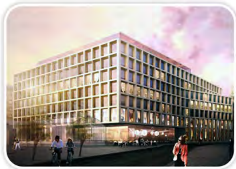
Unternehmenszentrale der Post AG, Wien