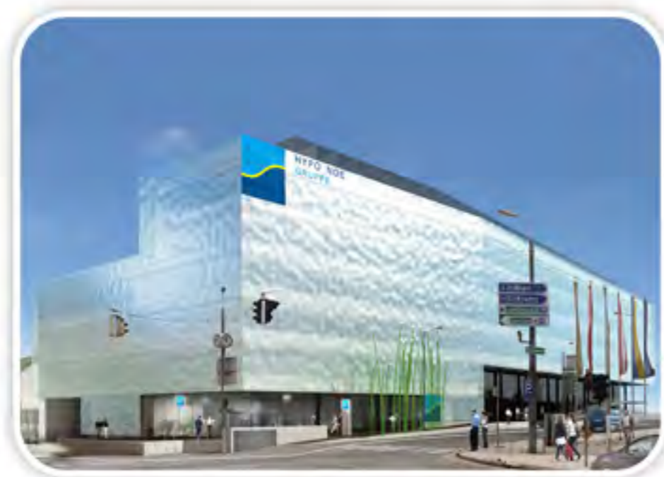
Headquarter HYPO-Group, St. Pölten